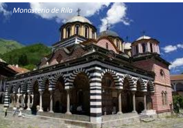
Monasterio de Rila

DIA 6 - Hoy tomarán el vuelo a su próximo destino.