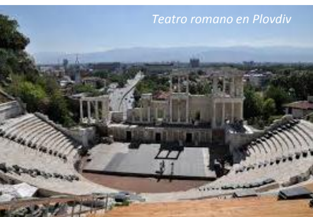
Teatro romano en Plovdiv